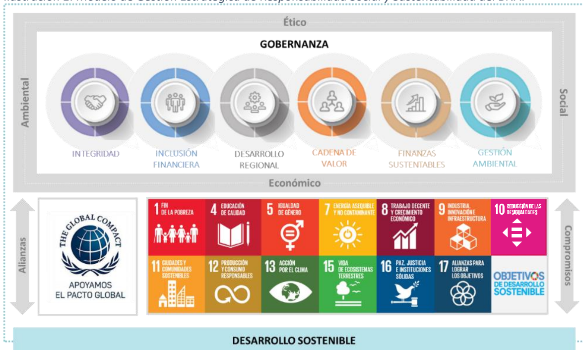
Ilustración 1: Modelo de Gestión Estratégica de Responsabilidad Social y Sustentabilidad del BNA.

El BNA es firmante del Pacto Mundial de Naciones Unidas desde el año 2017 y forma parte activa de la Mesa Directiva de la Red Argentina, entre diversos compromisos que asume en pos del desarrollo sostenible. En este marco, el Modelo de Gestión Estratégica de Responsabilidad Social y Sustentabilidad del BNA se encuentra alineado a la Agenda 2030.